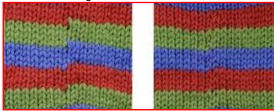
dit wil je liever niet

Bij het breien van strepen ontstaat er een overgang die duidelijk zichtbaar is als je verandert van kleur. Dit is echter eenvoudig te voorkomen.